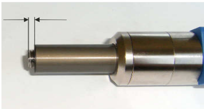
Vor der Einstellung / Before adjustment