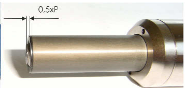
Nach der Einstellung / After adjustment

Nach dem Einbau eines neuen Gewindelehrdornes erfolgt die Justierung der DigiMultiCheck.