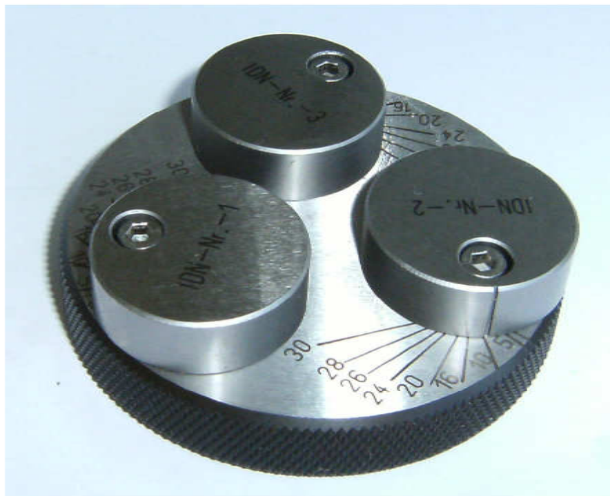
Einstellehre für MultiCheck / Setting gauge for MultiCheck

Weitere Informationen zur Gewindetiefenmessung finden Sie auf unserer Homepage, oder wenden Sie sich an unseren Technischen Vertrieb.